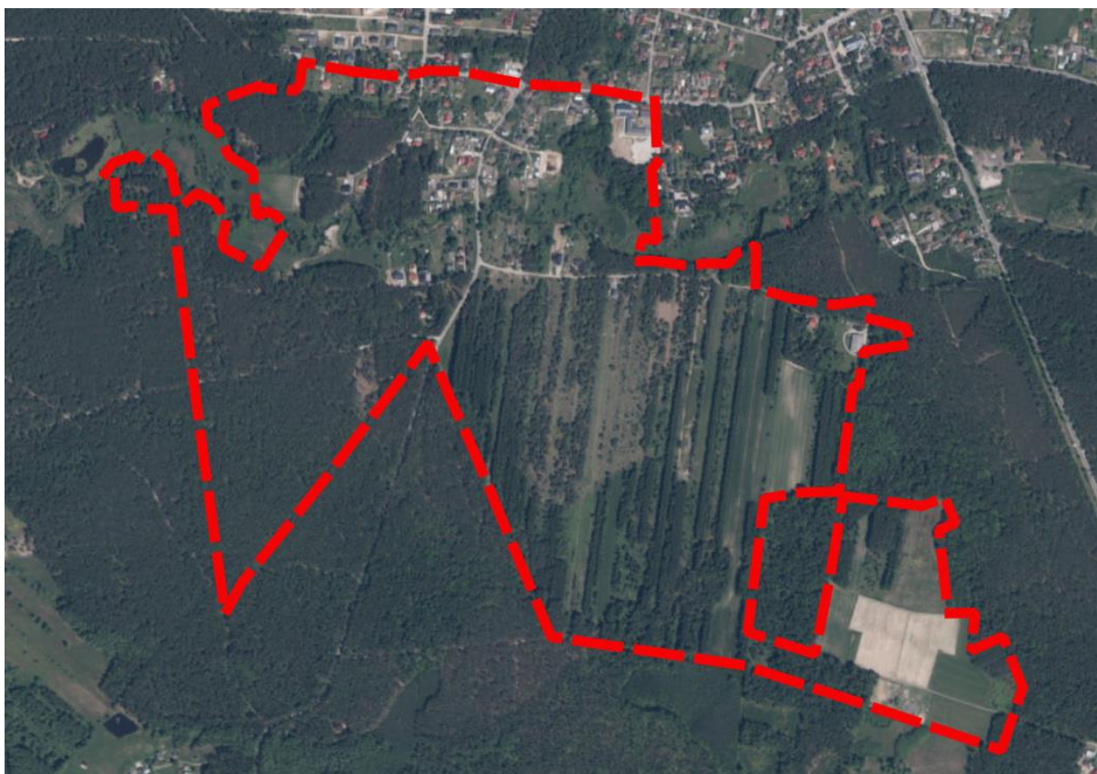
Rysunek 2 Obszar objęty ustaleniami planu miejscowego na tle ortofotomapy. (Źródło: opracowanie własne, źródło mapy: geoportal.gov.pl)

Poza granicami przedmiotowego obszaru, w jego sąsiedztwie, znajdują się budynki mieszkalne i usługowe. Poza powyższymi zabudowaniami, w pobliżu obszarów opracowania nie znajdują się żadne obiekty kubaturowe. Obszar otoczony jest głównie przez tereny leśne.